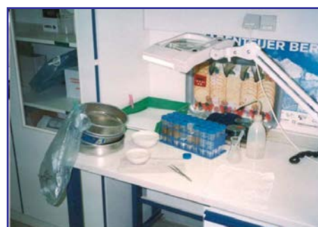
...und Konservierung in Alkohollösung