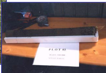
Entnahme von Boden-Wurzel Proben